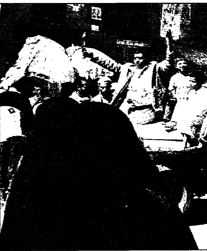
مستوطنون يحتفلون بفرز حزب المؤتمر في صنعاء

صنعاء - «القدس العربي» - من محمود معروف: